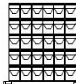
Galón (Empaque 4 Unid.)